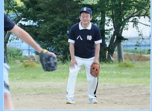
増田西地区レクリエーション大会

日青少年問題協議会 26日高柳辻地区集合復興公営住宅完成見学会 27日交通安全協会増田西地区総会、ふえりくちえ感謝祭 28日増田西地区青少年健全育成会総会 29日増田西地区福祉委員会総会 31日手をつなぐ育成会総会 6月2日観光物産協会総会 3日八幡南町内会花壇整備 11日増田西地区レクリエーション大会、熊野那智神社講話会 13日ゆりりん愛護会総会 17日青少年健全育成会名取市民会議総会 18日八幡南町内会側溝清掃、KPMフォーラム、参議院議員和田政宗国政報告会、山田しろう市政報告会 24日閉上東地区被災市街地区画整理工事安全祈願祭・起工式 25日阿武隈川下流左岸水防工法訓練 27日ゆりあげ港朝市協同組合総会 防火クラブ総会 14日増田西地区防火協力会総会 15日総務消防常任委員会行政視察 19日増田西衛生協力会総会 20日増田西小学校大運動会、名取市自衛隊協力会総会 21日大手町一丁目町内会共同清掃 23日閉上地区第二期戸建復興公営住宅完成見学会 24日