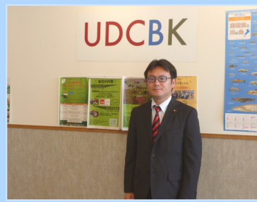
常任委員会行政視察

4月 大手町1丁目町内会・大手町2丁目町内会・郷土史研究会・二つの名取を結ぶ会・ボランティア連絡会増田西部地区・増田西部地区子ども会育成会・増田西部地区町内会連合会の総会、増田西小学校・第二中学校の入学式などに出席しました。 5月 憲法記念日に街頭活動に参加し、地方自治充実のため憲法第8章の改正を訴えました。総務消防常任委員会で関西地方を視察し、自治体シンクタンクなどについて調査しました。KPM増田川清掃に参加しました。自衛隊協力会・増田西公民館運営協力委員会など各種団体の総会に出席しました。これまでの「ありがとう」とこれからの「よろしく」の思いを込めた復興促進イベントが開催されました。 6月 名取市総合防災訓練が相互台小学校で行われました。ドローンによる医薬品の空輸訓練や、生コンクリート協会などと結んだ協定に基づくミキサー車による水の運搬訓練などが行われました。 議会運営委員会に関西地方を視察し、議会基本条例の検証と評価などについて調査しました。