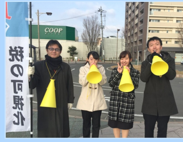
春の議員インターン受け入れ