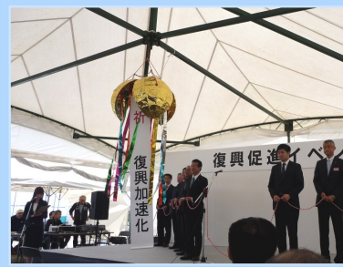
関上復興促進イベント