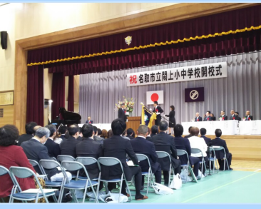
関上小中学校開校式