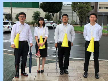
夏の議員インターン受け入れ