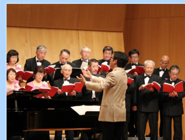
混声合唱団せせらぎ定期演奏会

7月 混声合唱団せせらぎ第9回定期演奏会に指揮者として出演しました。相互台公民館で市政報告会を開催しました。議会広報特別委員会、愛知県内を視察し、声の議会広報などについて調査しました。老人スポーツ大会、増田西小学校子ども祭り、KPM増田川清掃活動、消防操法指導会、大手町1丁目町内会夕涼み会などに出席しました。 8月 亘理名取地区市町議会議員研修会に出席しました。KPMガサガサ体験と増田西公民館主催わくわく子供体験に協力しました。那智が丘公民館で市政報告会を開催しました。議員協議会において、仙台空港運用時間延長に関する考え方、復興関連事業スケジュール、復興公営住宅の一般募集などについて説明を受けました。 9月 敬老大会、ゆりりん愛護会植樹会、婦人防火クラブ連絡協議会体験学習会、みのり会広場、市制施行六十周年記念式典、熊野三山シンポジウムなどに出席しました。 10月 増田西老人憩の家で市政報告会を開催しました。老人クラブ芸能大会、婦人防火推進大会