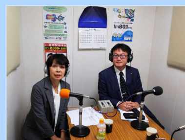
議会懇談会コマーシャル収録

増田西小学校学習発表会、大手町1丁目町内会・八幡北町内会芋煮会などに出席しました。KPM増田川清掃・増田西小での出前授業・サケ観察会に参加しました。なとり文化芸術祭に出演しました。 11月 議員協議会において、市民墓地整備事業、サイクルスポーツセンター、都市計画マスタープランなどについて説明を受けました。西部町内会芋煮会、八幡南町内会親睦会などに出席しました。会派で石川県能美市・小松市、富山県南砺市を視察し、小規模多機能自治などについて調査しました。 12月 名取市民合唱祭が開催されました。復興公営住宅完成式典、わいわいハッピータイム、名取駅前地区第一種市街地再開発事業ランドオーブン、新名取市図書館開館記念式典などに出席しました。