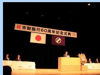
市制施行60周年記念式典