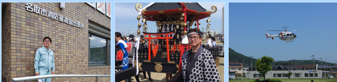
総務消防常任委員会現地調査