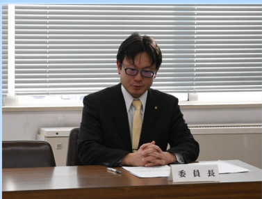
2月議会 総務消防常任委員会