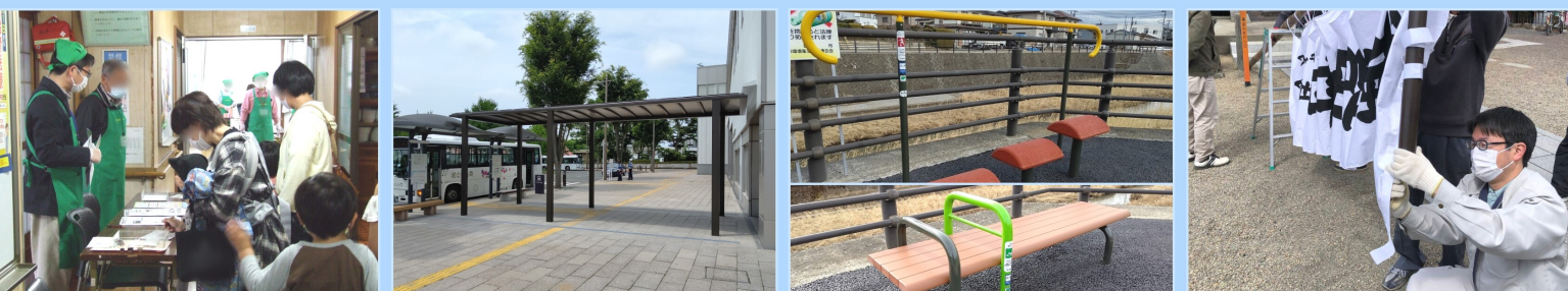
なとり子ども食堂 名取駅西口バスシェルター設置 増田川健康遊具設置 増田神社 例大祭準備

1月 成人式などに出席しました。議員協議会において、新型コロナウイルス対策の実施、ルスクン接種の最終決定、建設候補予定地の決定、仙台空港運用時間延長(24時間化)について説明を受けました。後に地域振興策と騒音対策の要望を受け入れられ、県に結ぶ仙台市地下鉄の延伸への協力を求める交渉の機会となりました。報告です。地域支え合い報告会、共生社会について考える講座に参加しました。 2月 議員協議会において、消防署手倉田出張所の移転改築、総合福祉センターの整備、仙台空港の運用時間延長(24時間化)の対応方針について説明を受けました。新しに出張所へ救急車を早期に配備し、跡地の活用には地域住民の意見を反映させよう、地元選出議員が連携して求めてまいります。増田川の手倉田ふれあい橋・大手橋間2か所に、老朽化したベンチの撤去に伴って健康遊具設置が実現しました。残る1か所にも早期に設置されるよう要望を続けてまいります。