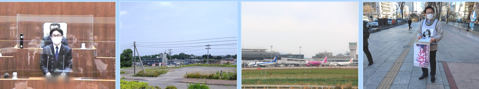
2月定例会 討論 手倉田出張所移転改築へ 仙台空港運用時間延長 救う会宮城 街頭署名活動

1月 成人式などに出席しました。議員協議会において、新型コロナウイルス対策の実施、ルスクン接種の最終決定、建設候補予定地の決定、仙台空港運用時間延長(24時間化)について説明を受けました。後に地域振興策と騒音対策の要望を受け入れられ、県に結ぶ仙台市地下鉄の延伸への協力を求める交渉の機会となりました。報告です。地域支え合い報告会、共生社会について考える講座に参加しました。 2月 議員協議会において、消防署手倉田出張所の移転改築、総合福祉センターの整備、仙台空港の運用時間延長(24時間化)の対応方針について説明を受けました。新しに出張所へ救急車を早期に配備し、跡地の活用には地域住民の意見を反映させよう、地元選出議員が連携して求めてまいります。増田川の手倉田ふれあい橋・大手橋間2か所に、老朽化したベンチの撤去に伴って健康遊具設置が実現しました。残る1か所にも早期に設置されるよう要望を続けてまいります。