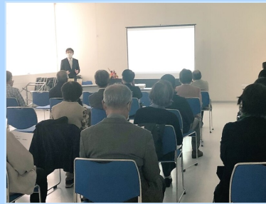
第1回 市政報告会+連続講演会