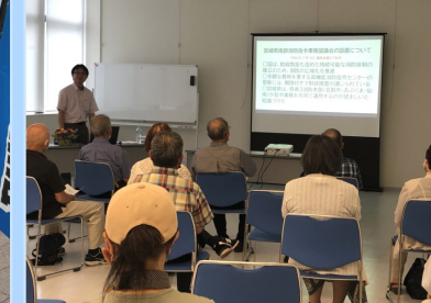
第2回 市政報告会+連続講演会

プロジェクト海岸清掃に参加しました。会派で九州地方3市を視察し、ダム周辺整備などについて調査しました。議員協議会において、なとりスパーキッズ育成事業について説明を受けました。 6月 名取市総合防災訓練、青少年健全育成名取市民会協議会、宮城県消防協会名取・巨理地区支部水防訓練、名取市観光物産協会社員総会などに出席しました。増田西地区民レクリエーション大会、八幡南町内会花壇整備・共同清掃に参加しました。第2回市政報告会+連続講演会を開催しました。