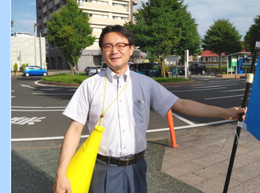
ノーマイク街頭活動9年目へ