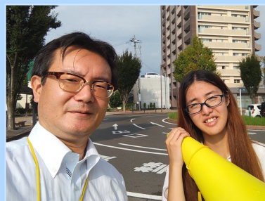
夏の議員インターン受入れ