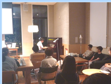
ナイトライブラリー