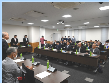
姉妹都市新宮市表敬訪問

12月 名取市民合唱祭 行委員会で、第5回合唱 祭の開催日が令和6年11 月10日に決定しました。 市政報告会+第4回連続 講演会を開催しました。 宮城県農業高等学校合唱 部主催のクリスマスコン サートに出演しました。