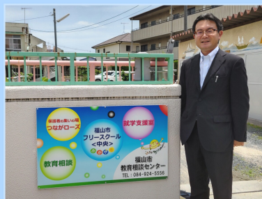
民生教育常任委員会行政視察

10月 新宮市と姉妹都市 盟約を締結して15年目の 節目の年であることから、 市議会を訪問し、表敬訪 問セレモニーと意見交換 会に出席しました。また、 防災対策について、新庁 舎見学、議会の概要・災 害時の議会対応について 研修を受け、文化複合施