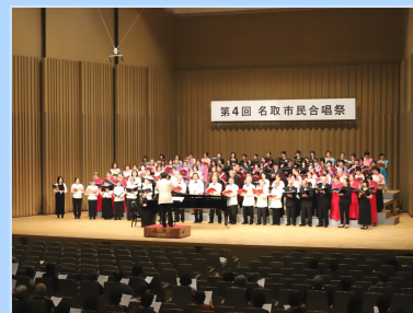
第4回名取市民合唱祭